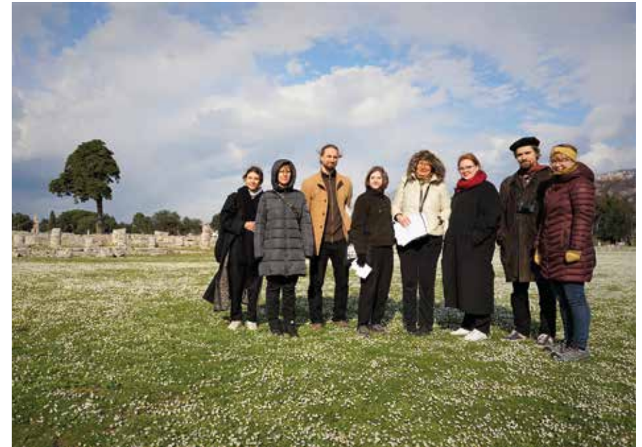
Tieteellinen kurssi Paestumissa maaliskuussa 2022.

Instituutti osallistui kuuden opiskelijan ja nuoren tutkijan voimin nykyisen Santa Marinellan kunnan alueella sijainneen roomalaisen kolonian Castrum Novumin arkeologisiin kaivauksiin syyskuussa. Kaivaukset