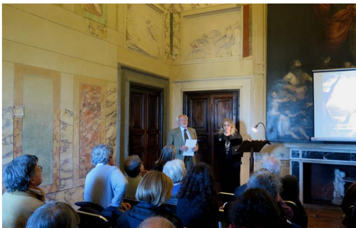
Esitelmätilaisuudet järjestetään yhdessä Amici di Villa Lante al Gianiclo -yhdistyksen kanssa.

Yhteistyö Suomen Rooman- ja Pyhän Istuimen suurlähetystöjen kanssa oli läheistä halki vuoden. Sen muodoista mainittakoon pyhän Henrikin messun ympärillä olleet ekumeeniset tilaisuudet tammikuussa sekä Team Finland -hankkeet. Instituutti