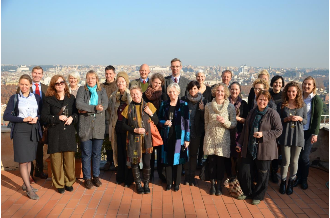
Pohjoismaisten instituuttien henkilökunta perinteisellä joululounaalla