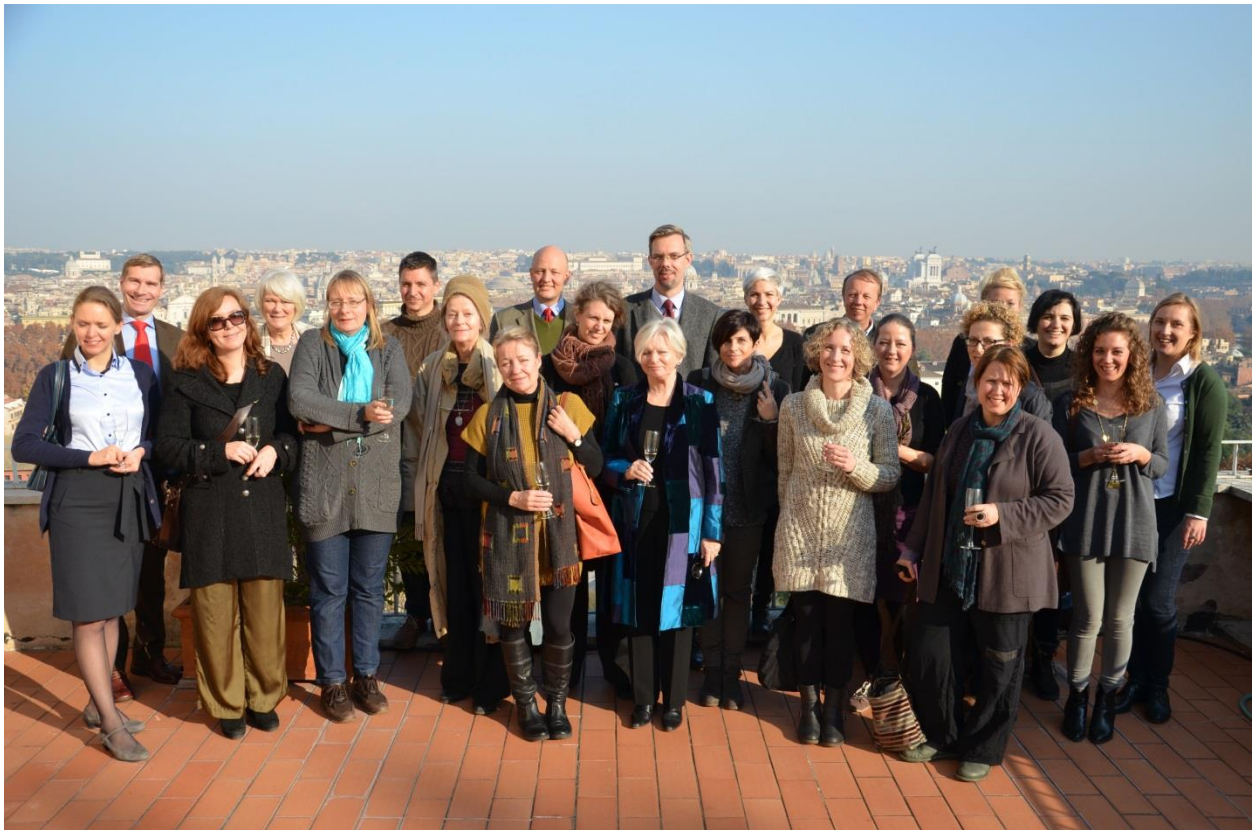
Pohjoismaisten instituuttien henkilökunta perinteisellä joululounaalla