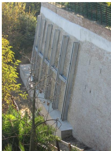
Villa Lanten alaterassin tuentatyöt: uudet tukipaalut

Normaalin käyttö- ja tarve-esineitten hankinnan ohella instituutin irtaimistoa uusittiin vuonna 2013 vaatimattomasti. Tietokonekalustoa uusittiin osittain Villa Lanten ystävien antaman taloudellisen avun turvin; ostettiin uusi pöytäkone, kannettava tietokone ja dataprojektori. Vuosien mittaan tahriutunut johtajan asunnon sohvakalusto verhoiltiin uudelleen. Pesulaan hankittiin mankeli.